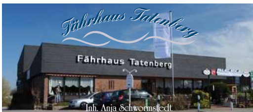
Inh. Anja Schwormstedt